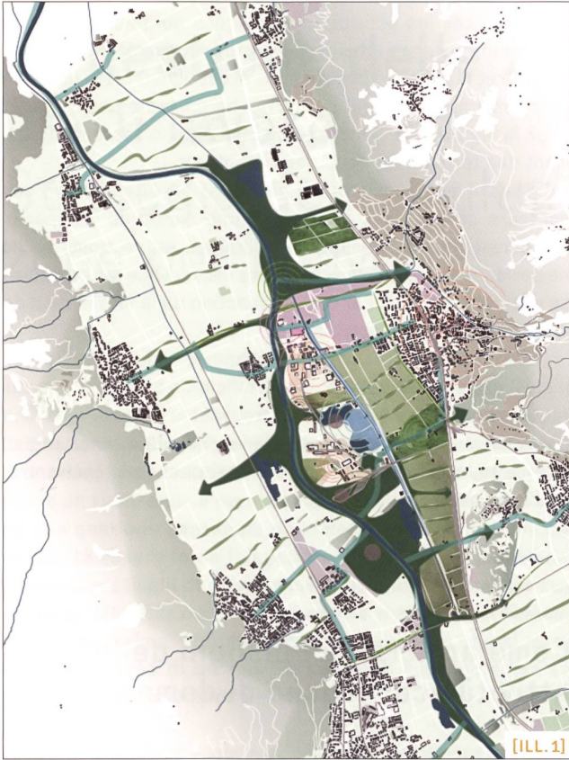
[ILL. 1] La structuration par les réseaux / La strutturazione basata sulle reti / Struktur der Netze