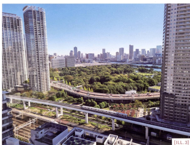
[ILL. 3] De la ville des flux à la ville flux: shinkansen, jardin Hamarykyu et front de mer verticalisé / Dalla città dei flussi alla città flusso: lo shinkansen, il parco Hamarykyu e il lungomare verticalizzato / Von der Stadt der Flüsse zur Stadt im Fluss: Shinkansen, Hamarykyu-Park und vertikalisierte Uferpromenade (Photo: Raphaël Langullon, le 19 octobre 2021)