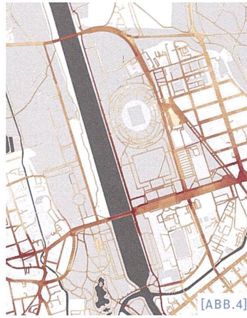
[ABB.4] Fussverkehrs-Bedeutungsplan der Stadt Leipzig / Plan du volume de trafic piétonnier à Leipzig / Piano delle aree di maggior traffico pedonale a Lipsia