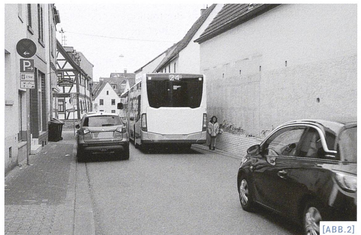
[ABB.2] Fussverkehrs-Alltag / Le quotidien d'un-e piéton-ne / Essere pedoni nella vita di tutti i giorni