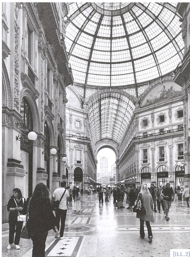
[ILL.2] Galleria Vittorio Emanuele II, Milano