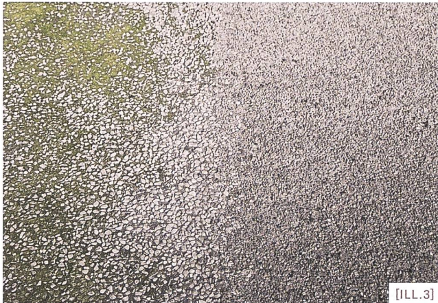
[ILL.3] Pavimentazione con diversi gradi di permeabilità, montaggio per il Concorso Ex-Mattatoio di Hollerich/ Unterschiedlich durchlässige Böden, Fotomontage für den Wettbewerb zur Umgestaltung des ehemaligen Schlachthofs von Hollerich/ Revêtements de sol à différents degrés de perméabilité, montage pour le concours des anciens abattoirs de Hollerich

problemi strutturali per la maggior parte degli edifici in quanto maggiore spessore significa maggiore carico e anche maggiore ritenzione idrica.