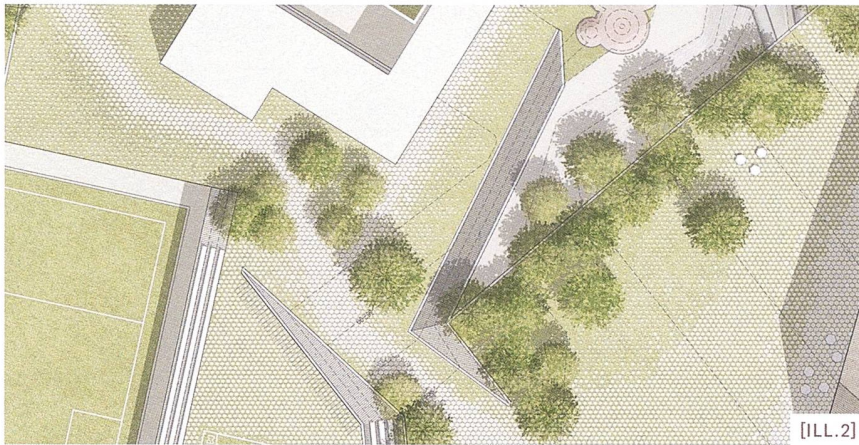
[ILL.2] Gradiente di permeabilit diagramma, Parco Sportivo Milland, Bressanone/ Diagramm Durchlässigkeitsgrad, Sport- und Freizeitpark Brixen Milland/ Diagramme du degré de perméabilité, parc sportif Milland, Bressanone