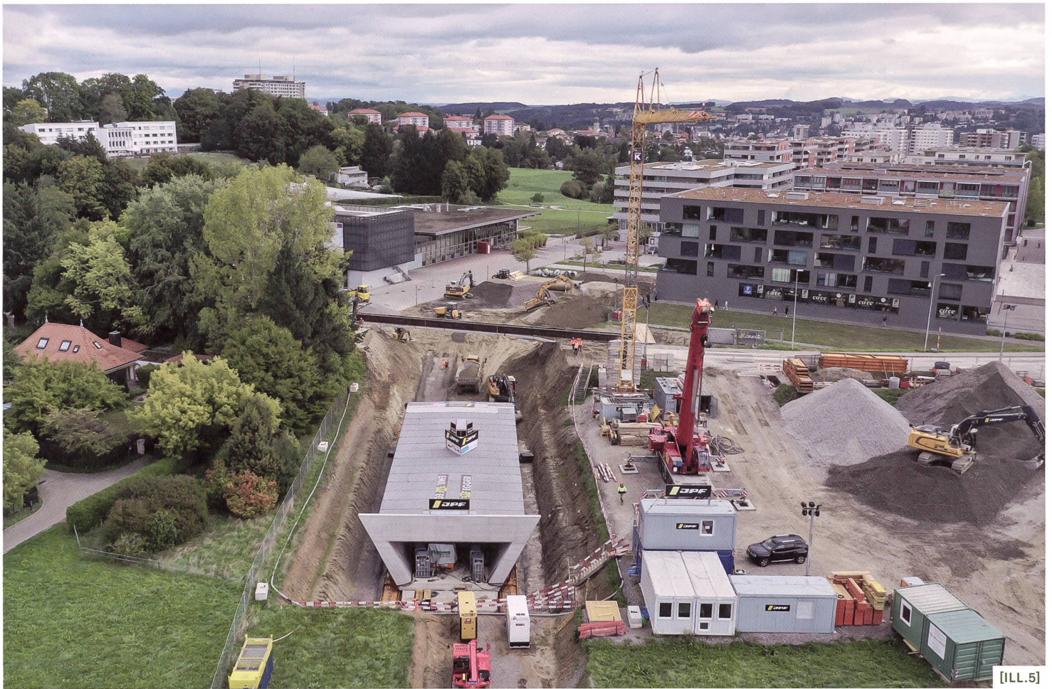
[ILL.5] Passage inférieur en construction sous la route cantonale à Villars-sur-Glâne, ouvrage de 1500 tonnes / Bau der Unterführung an der Kantonsstrasse in Villars-sur-Glâne, ein 1500 Tonnen schweres Bauwerk / Sottopasso in costruzione sotto la strada cantonale a Villars-sur-Glâne, un'opera di 1500 tonnellate