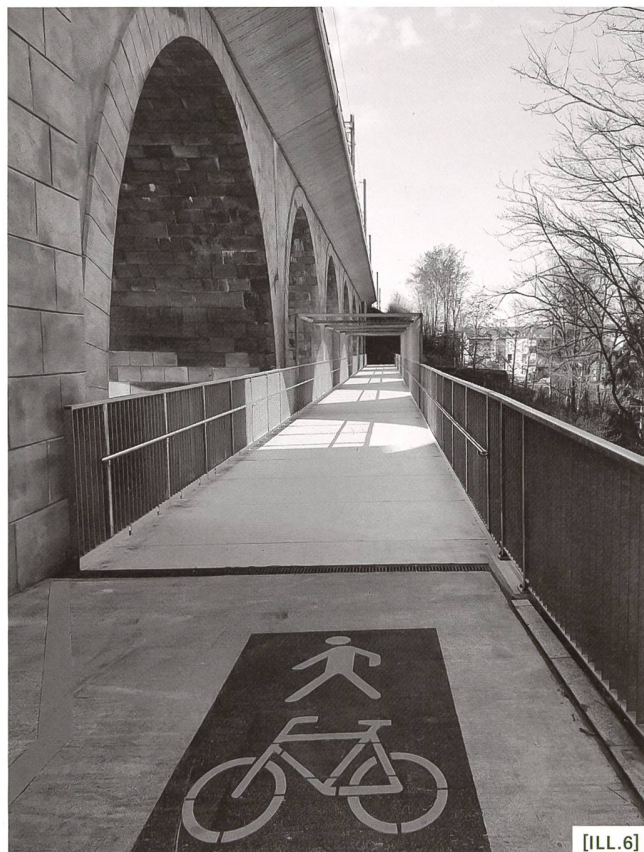
[ILL.6] La passerelle de 92 mètres de long du Toggeliloch à Guin / Der 92 Meter lange Steg über das Toggeliloch in Düdingen / La passerella di 92 metri di lunghezza del Toggeliloch a Guin