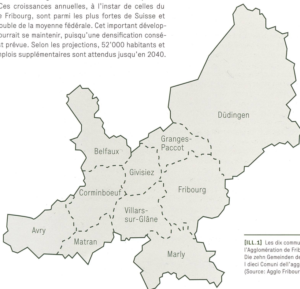
[ILL.1] Les dix communes formant l'Agglomération de Fribourg / Die zehn Gemeinden der Agglomeration Freiburg / I dieci Comuni dell'agglomerato friborghese

Ces dynamiques de développement démographique, combinées à l'urgence climatique, nécessitent une politique de mobilité durable et attractive. Cette dernière passe obligatoirement par une pratique forte du vélo grâce à un réseau séduisant les utilisateurs.