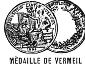
MÉDAILLE DE VERMEIL