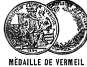
MÉDAILLE DE VERMEIL