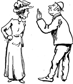
Tableau du lien conjugal.

la première fois que cet orchestre se faisait entendre ; nous en reparlerons à l'occasion d'une prochaine audition, qui déjà nous est promise.