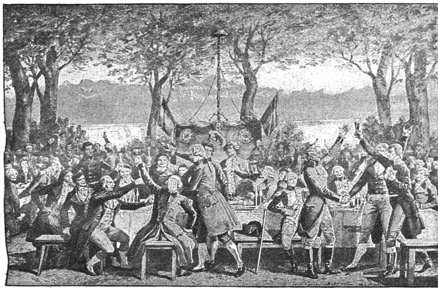
BANQUET DES JORDILS