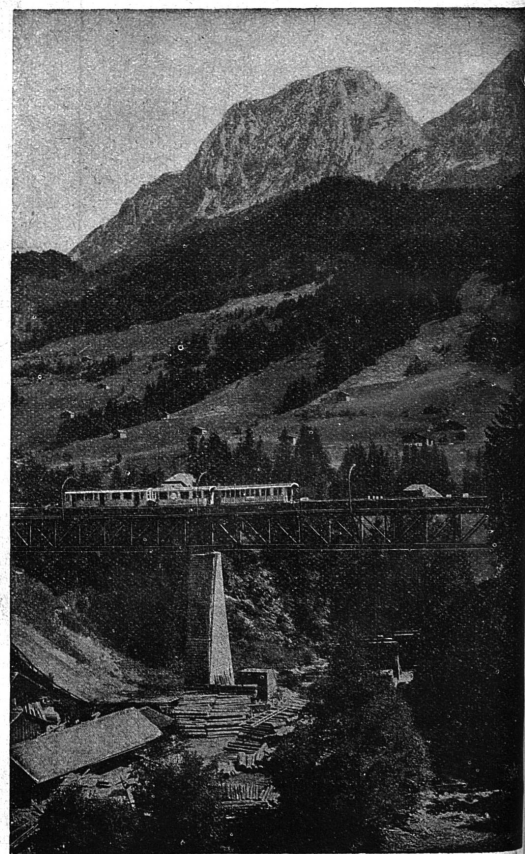
Viaduc de Flendruz.

Chemin de fer électrique Montreux-Oberland Bernois