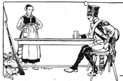
JEUNE ET VIEUX

— Ma foi, monsieur, ce n'est pas ma faute, mes souliers ne sont pas faits pour aller en chemin de fer.