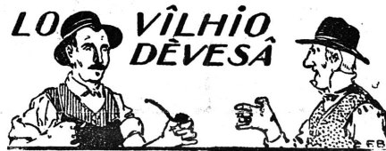
ONCLLIO ET NÉVAO