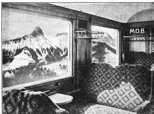
Voiture salon de la Cie Montreux-Oberland bernois.

FETISCH FRÈRES S. A. Lausanne, Rue de Bourg