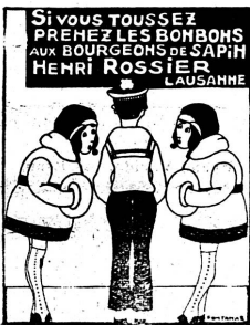
Henri ROSSIER et ses Fils successeurs

Accordages, réparations, échanges. Atelier spécial pour la réparation des pianos, pianos électriques, pianolas, phonolas, etc.