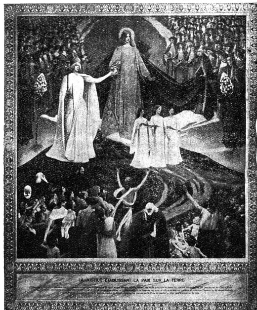
LA JUSTICE ÉTABLISSANT LA PAIX SUR LA TERRE

orne le Tribunal Fédéral à Montbenon-Lausanne. Elle exprime magnifiquement les aspirations de notre génération « à la Paix de la Justice »