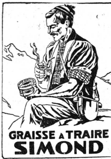
GRAISSE A TRAIRE SIMOND

Cette graisse stérilisée prévient les maladies de la tétine, quartier, crevasses et inflammations des pis. Elle facilite beaucoup le travail du trayeur.