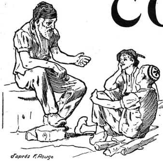
d'après F. Rouge

Rédaction et Administration : Imprimerie PACHE-VARIDEL & BRÛN , Lausanne Pré-du-Marché, 7