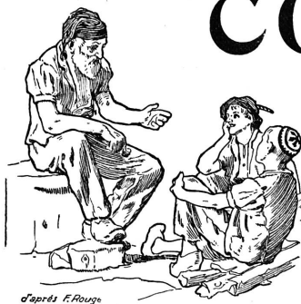
d'après F. Rouge

Rédaction et Administration : Imprimerie PACHE-VARIDEL & BRON , Lausanne Pré-du-Marché, 7