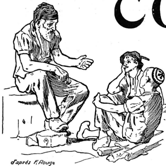
d'après F. Rouge