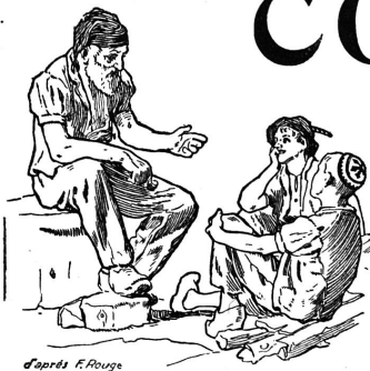
d'après F. Rouge

Rédaction et Administration : Imprimerie PACHE-VARIDEL & BRON , Lausanne Pré-du-Marché, 7