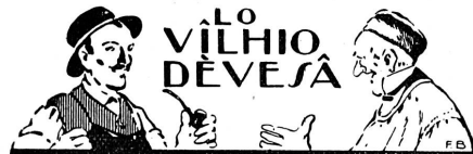
CLLIAO CRASET DE BOUBO !

Nous expédions le Conteur Vaudois à l'essai, espérant qu'un grand nombre de nos compatriotes comprendront qu'en s'y abonnant, ils encourageront les amis du patois et des coutumes vaudoises.