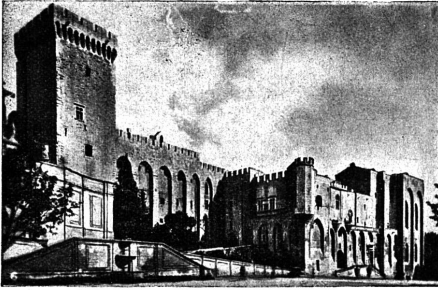
Château des Papes.

— La visite dure environ deux heures, déclare le chauffeur. Quand vous aurez parcouru toutes les salles, vous monterez au sommet de la Tour des Trouillas !