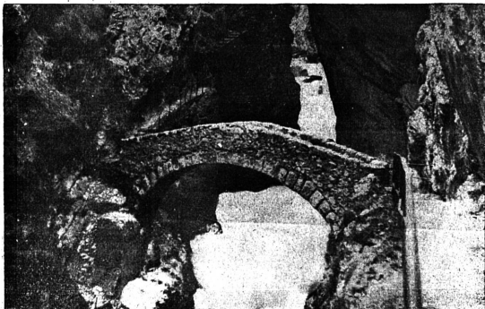
Le pont de Brot