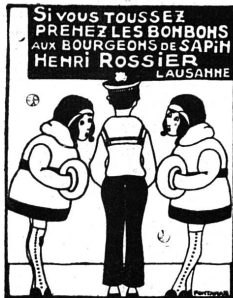
Rossier frères, succ.