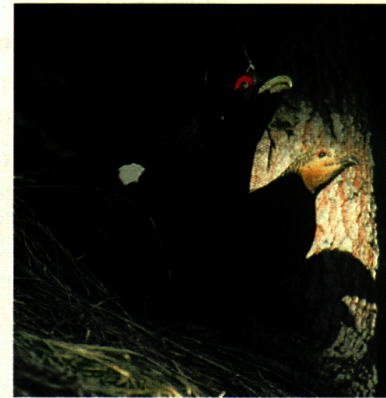
Hahn und Henne in Deckung vor einem Luftfeind

Chanel. Doch da die Ernährung der Hennen während der Zeit der Eiablage durch eine hohe Vielfalt gekennzeichnet ist und die ersten schneefreien, trockenen Stellen für die Nestanlage bevorzugt werden, kommt das Trupchuntal nur ausnahmsweise als Brutort in Frage. Die Hennen suchen deshalb, noch früher als die Hähne, entsprechend günstigere Gebiete in tieferen Lagen ausserhalb des Nationalparks auf. Doch bereits wenige Wochen später ist das Nahrungsangebot auch in der Val Trupchun günstig, sodass in der Nähe brütende Hennen gelegentlich auch die zur Aufzucht der Küken bevorzugten offenen Waldgebiete der linken Trupchunseite aufsuchen. Dort finden sie genügend Insekten,