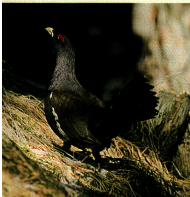
Über drei Jahre alte Hähne zeigen eine feste Bindung zu ihrem Balzrevier. Junge Hähne hingegen (s. Foto), erkennbar an ihrer geringen Schnabelhöhe und dem kurzen Schwanz, besuchen während der Hochbalz mehrere Balzplätze.

Die geringen Auerhuhnbestände im Engadin erlau- ben es nicht, Einzeltiere einzufangen, um deren Akti- onsradius mittels Telemetrie festzustellen. Deshalb habe ich mich der klassischen Methode der Auer- huhnforschung bedient. Direktbeobachtungen erfolg- ten entweder zufällig oder durch vorsichtiges Ver- hören an Balzplätzen. Dabei verwendete ich Tarnzelte. Indirekte Nachweise gelangen durch Spu- rensicherung im Schnee, durch Losungs- und Feder- funde, Eierschalen, Sandbäder oder Totfunde. Zur Vermeidung von Störungen habe ich während der Brutzeit auf die Begehung von potentiellen Brutgebieten verzichtet.