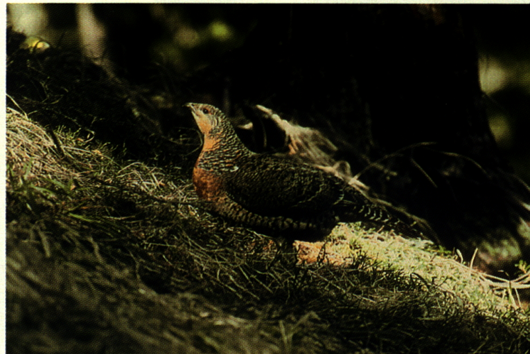
Auerhennen weisen eine unterschiedliche Zeichnung und Färbung der Hals- und Brustfedern auf.

Das Interesse am Auerhuhn hat in den letzten Jahren stark zugenommen. Die Forstwirtschaft ist heute weitgehend bereit, Massnahmen zur Verbesserung seines Lebensraumes zu treffen. Diese erfreuliche Entwicklung kann dieser Lebensgemeinschaft nur förderlich sein. Im Bewusstsein, dass dieses Biotop auch für uns Menschen «Leben» bedeutet und uns in vielfältiger Weise dient, sollte es uns leicht fallen, seine Bewohner zu schützen. Für das Auerhuhn gibt es keine Alternative.