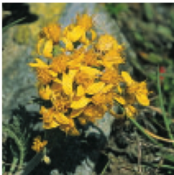
Krainer Greiskraut Senecio carnolicus , eine typische Pflanze saurer (quarzreicher) Böden

aus dem Zeitalter des Perm. Diese Gesteine werden auch als Verrucano bezeichnet. Es handelt sich bei diesen Sedimentgesteinen um den Abtragungsschutt jenes Gebirges, dass sich vor 300 Millionen Jahren in dieser Region auftürmte und anschließend erodiert wurde.