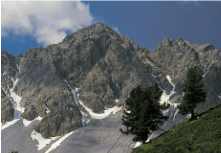
Oberhalb der Alp Tavrü öffnet sich der Blick auf den imposanten Piz Tavrü, 3168 m ü.M. Die letzten Arven wachsen auf 2300 m ü.M.