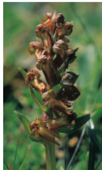
Grüne Hohlzunge Coeloglossum viride . Die Pflanze ist an ihrer dreiteiligen, bis zu einem Zentimeter langen Lippe erkennbar. Mit ihren braungrünen Farbtönen ist sie eine eher unscheinbare Orchidee.

Die hirschkreiche Val Foraz liegt im Nationalpark. In der Mitte der Piz Foraz, 3093 m ü.M.