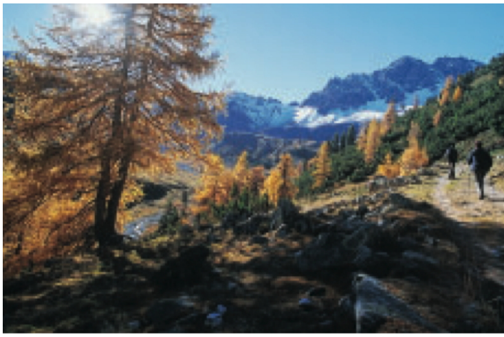
Unterhalb der Alp Tavrü