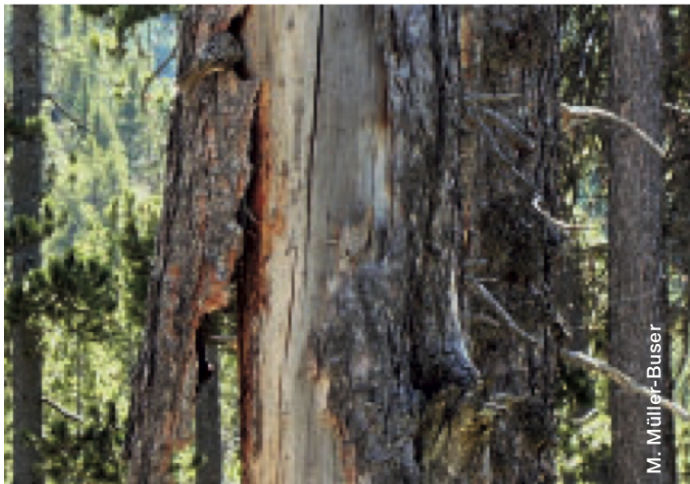
Abbildung 1: Perfekt geschütztes Nest eines Waldbaumläufers unter der Rinde einer abgestorbenen Bergföhre mit loser Rinde.