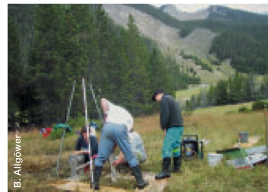
Abbildung 3: Entnahme des Bohrkerns zur Langzeitfeuergeschichte bei Il Fuorn. Im Hintergrund ist die Brandfläche aus dem Jahre 1951 sichtbar.