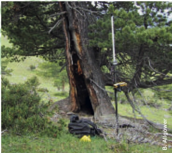
Abbildung 1: Feuerspuren: Deltoide (dreieckige) Feuerverletzung (cat face) und Blitzspuren an einer Arve an der Baumgrenze am Munt Chavagl.

Die Berichterstattung zu Waldbränden stellt fast immer Tod und Verderben in den Vordergrund: «Tausende Hektaren Wald in Kanada durch Feuer zerstört, australische Buschbrände bedrohen Wohngebiete». So oder ähnlich lauten die Schlagzeilen. Dabei wird übersehen, dass Feuer auch Ursprung neuer Lebenszyklen sind. So keimen feuerliebende (pyrophile) Arten bevorzugt nach Waldbränden. Im borealen Wald (Nordamerika/Sibirien) tragen Brände zur periodischen Erneuerung grosser Waldflächen und damit zur langfristigen Stabilität dieser Ökosysteme bei.