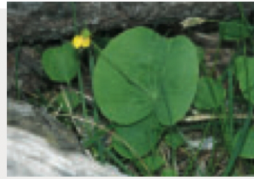
Der seltene und fast ebenso giftige Thora-Hahnenfuss Ranunculus thora blüht im Juni und versteckt sich unter den Legföhren.

Hans Lozza Schweizerischer Nationalpark, 7530 Zernez