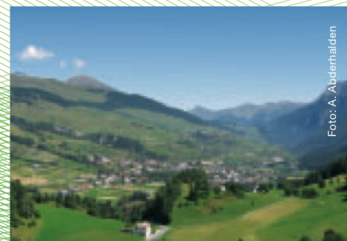
Das Talgebiet im Unterengadin bildet einen wichtigen Korridor zwischen den Ost- und den Westalpen wie auch zwischen dem Schweizerischen Nationalpark und den grossen Schutzgebieten in Tirol.