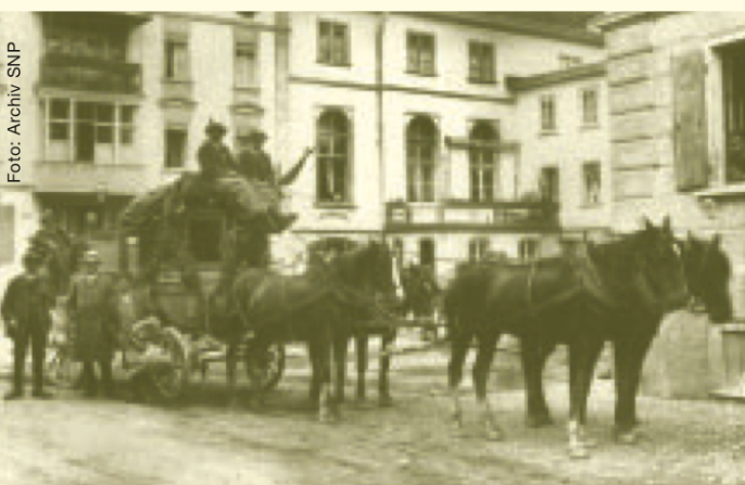
Postkutsche vor dem Hotel Baer&Post in Zernez, undat. Aufnahme. Bis zur Eröffnung der RhB-Strecke ins Unterengadin 1913 war die Kutsche das übliche Verkehrsmittel.