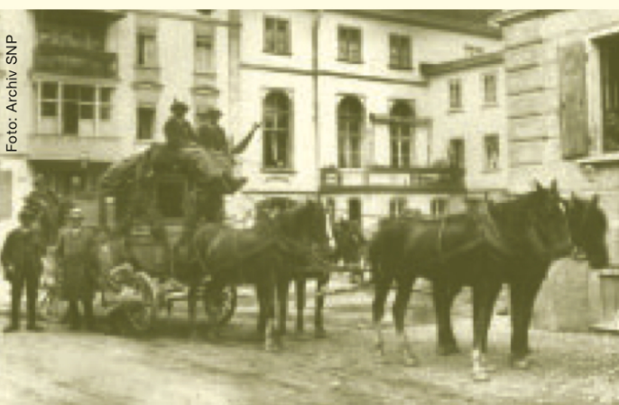
Postkutsche vor dem Hotel Baer&Post in Zernez, undat. Aufnahme. Bis zur Eröffnung der RhB-Strecke ins Unterengadin 1913 war die Kutsche das übliche Verkehrsmittel.