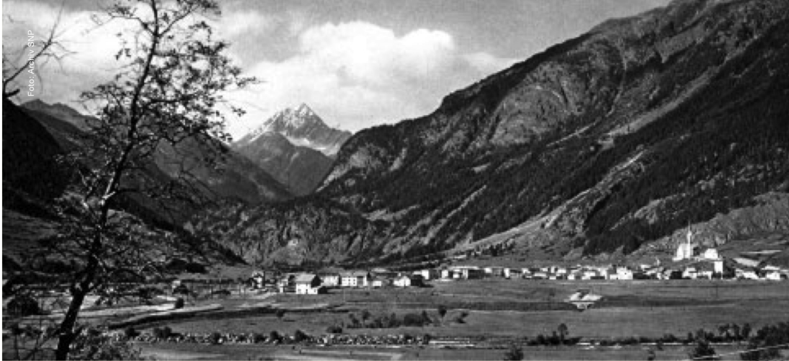
Zernez zur Zeit der Parkgründung