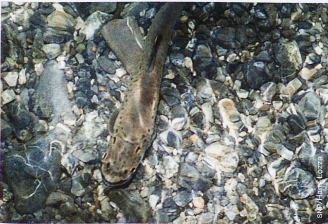
Bachforelle im Spöl

In dieser Arbeit wurde untersucht, welche Habitate Bachforellen ( Salmo trutta fario ) für ihre Reproduktion nutzen und wie man eine Modellierung ihres Laichhabitats erarbeiten könnte, sodass eine Eignungsklassifizierung der angebotenen Laichplätze eines Flussabschnittes möglich wäre. Dazu wurden 37 Bachforellenlaichgruben im Spöl empirisch untersucht. Die Laichgrubenstruktur und Mikrohabitatparameter wie Wassertiefe, Fließgeschwindigkeit über der Flusssohle und Substratgrösse wurden erhoben. Zusätzlich zu den 37 untersuchten Laichgruben wurden weitere 126 Laichplätze kartiert. Aus der Analyse der Laichgruben geht hervor, dass die Bachforellen ihre Laichgruben im Spöl am häufigsten in Wassertiefen zwischen 10 – 20 cm graben. Dabei betragen die Fließgeschwindigkeiten oft zwischen 0,2 – 0,3 m/s. Die dominante Substratkategorie in den Laichgruben ist grobkörniger Kies ( \varnothing 16 – 32 mm).