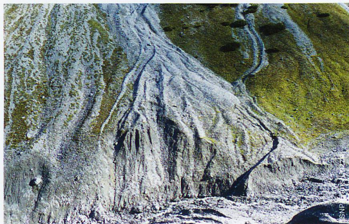
Murgänge erreichen in der Val Müschauns das Bachbett.

Die Ergebnisse der Arbeit zeigen, dass der Sedi-