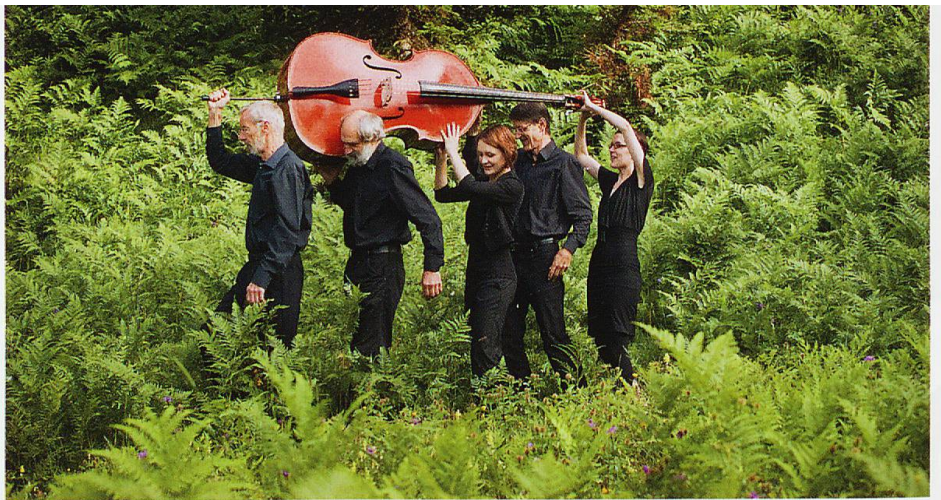
Ils Fränzlis da Tschlin