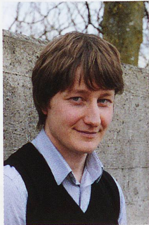
Simon Engeli Autor/Autor