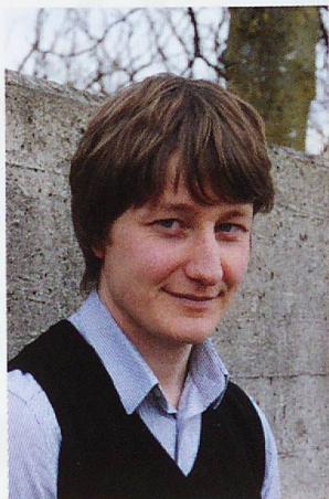
Simon Engeli Auteur/Autore