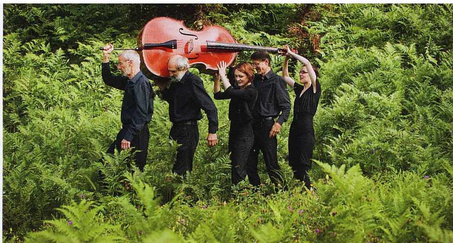
Ils Fränzlis da Tschlin