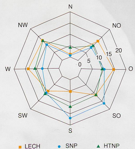
Abb. 1 Prozentuale Verteilung der genutzten Hangausrichtungen in den 3 Untersuchungsgebieten Nationalpark Hohe Tauern (HTNP), Schweizerischer Nationalpark (SNP) und Lechquellengebirge (LECH). Die hohe Nutzung von Südhängen im SNP ist ein Indiz für eine höhere Verfügbarkeit solcher Hänge, entweder aufgrund der topografischen Verhältnisse oder möglicherweise dank dem Schutz vor Störungen, z.B. durch Touristen.

Um dieser Frage nachzugehen, müssen zunächst quantifizierbare Verhaltensweisen des Steinbocks gefunden werden. Eine Möglichkeit, Verhalten zu «messen», bietet die Erfassung des Streifgebietes bzw. des Aktionsraumes. Damit ist die Fläche gemeint, die ein Individuum für regelmässige Aktivitäten wie die Nahrungsaufnahme und das Wiederkäuen in einem bestimmten Zeitraum, zum Beispiel während des Sommers, nutzt. In der Wildtierökologie wird grundsätzlich angenommen, dass diese Grösse mit der Ressourcendichte im Lebensraum in Zusammenhang steht. Sind beispielsweise gute Äsungs- und Rückzugsareale im Habitat häufig, so erübrigen sich viele energieraubende und teilweise gefährliche Wanderungen und der Aktionsraum fällt klein aus. In einer Masterarbeit sollte der Einfluss unterschiedlicher Lebensbedingungen auf den Aktionsraum des Alpensteinbocks untersucht werden. Dazu wurden anhand von GPS-Daten von 24 männlichen Steinböcken aus dem Schweizerischen Nationalpark, dem Nationalpark Hohe Tauern (HTNP) und dem Lechquellengebirge (LECH) Streifgebiete berechnet und deren Grösse in Zusammenhang mit Klima und Topografie gesetzt.