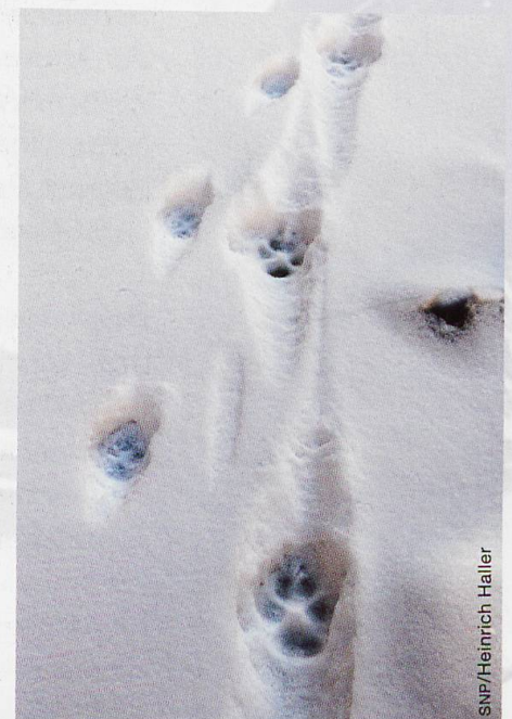
Abb. 1 Der erste gesicherte Nachweis eines Wolfs im SNP: Wolfsspur (rechts, links Rotfuchs) in der Val da Stabelchod, 24. Dezember 2016

Wie oben angedeutet, hat im Leben der grossen Säugetiere des Nationalparks bis anhin ein grundlegendes Phänomen weitgehend gefehlt, nämlich der Jagddruck durch Prädatoren. Die in der Natur fundamentale Wechselwirkung zwischen Räuber und Beute hat erst zu jenen Anpassungen geführt, die wir gerade bei Huftieren bewundern, zum Beispiel die Kletterfähigkeit des Steinbocks oder die hohen Nachwuchsraten von Rothirsch und Reh. Von daher liegt es auf der Hand, dass die Rückkehr vorab der beiden eigentlichen Beutegreifer Wolf und Luchs zu Entwicklungsprozessen führt, die für den SNP von grundlegender Bedeutung sind. Mehr noch, unser Nationalpark wurde ja gerade deswegen geschaffen, um natürliche Wirkungsweisen zu ermöglichen und diese zu erforschen.