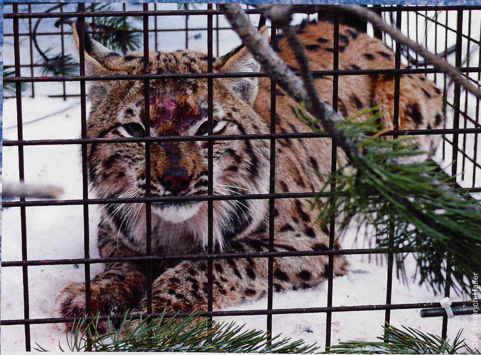
Abb. 4 Ein Highlight: Der Fang eines vorübergehend im SNP ansässigen Luchses; Val dal Spöl, 22. Februar 2008