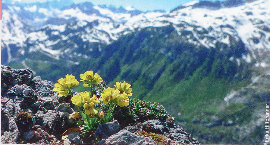
Abb. 4 Schöne, überraschende Vielfalt: Das immergrüne Felsenblümchen Draba aizoides mit Blick auf das Finsteraarhorn