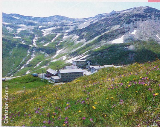
Abb. 2 Die Forschungsstation ALPFOR auf 2450 m ü. M. ist eingebettet in eine besonders vielfältige alpine Natur. Im Vordergrund ein Bürstlingsrasen mit blühendem Alpenklee Trifolium alpinum .