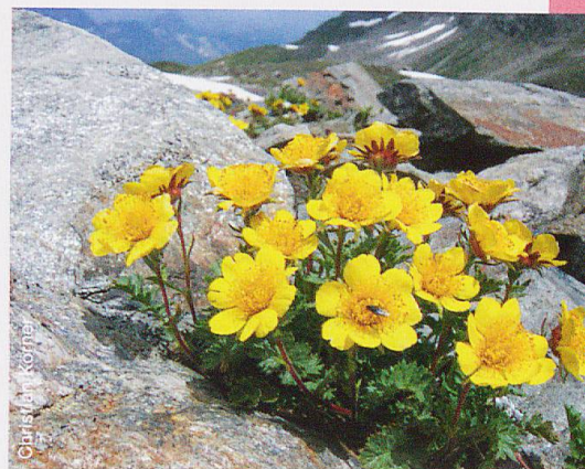
Abb. 1 Das Gletschervorfeld erweist sich als besonders artenreich. Die kriechende Nelkenwurz oder auch Petersbart genannt Geum reptans ist mit seinen Ausläufern auf Schutt ein Beispiel einer besonders erfolgreichen Art.

Räumlich stark schwankende Lebensbedingungen bewirken im Hochgebirge ein reiches Spektrum an Arten, die sich mit ihren unterschiedlichen Ansprüchen gegenseitig nicht nur konkurrenzieren, sondern auch ergänzen. Zusammen bilden Pflanzen und Tiere an jedem Kleinstandort ein komplexes Nahrungsnetz. Um solche wechselseitigen Beziehungen aufzudecken, ist es nötig, für die Arten streng lebensraumspezifische Inventare zu erstellen. Die Analyse der Biodiversität auf der Furka orientierte sich an diesem Habitatkonzept.