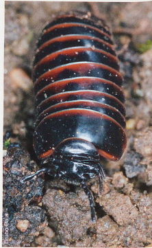
Abb. 3 Glomeris alpina , ein Tausendfüssler, der wesentlich zum Abbau von totem Pflanzenmaterial im sNP beiträgt.