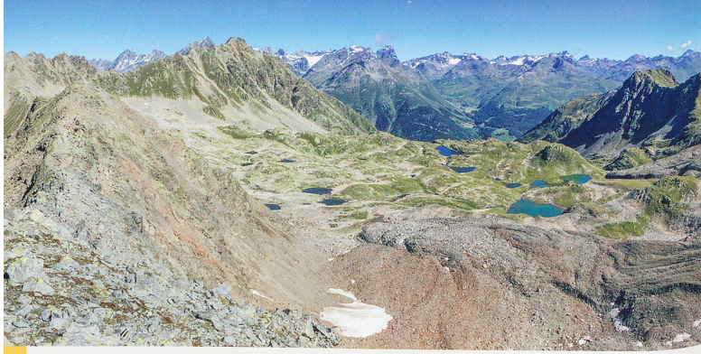
Abb. 4 Seenplatte Macun: Wie verändert der Klimawandel den Lebensraum von Tieren und Pflanzen in den Gewässern?