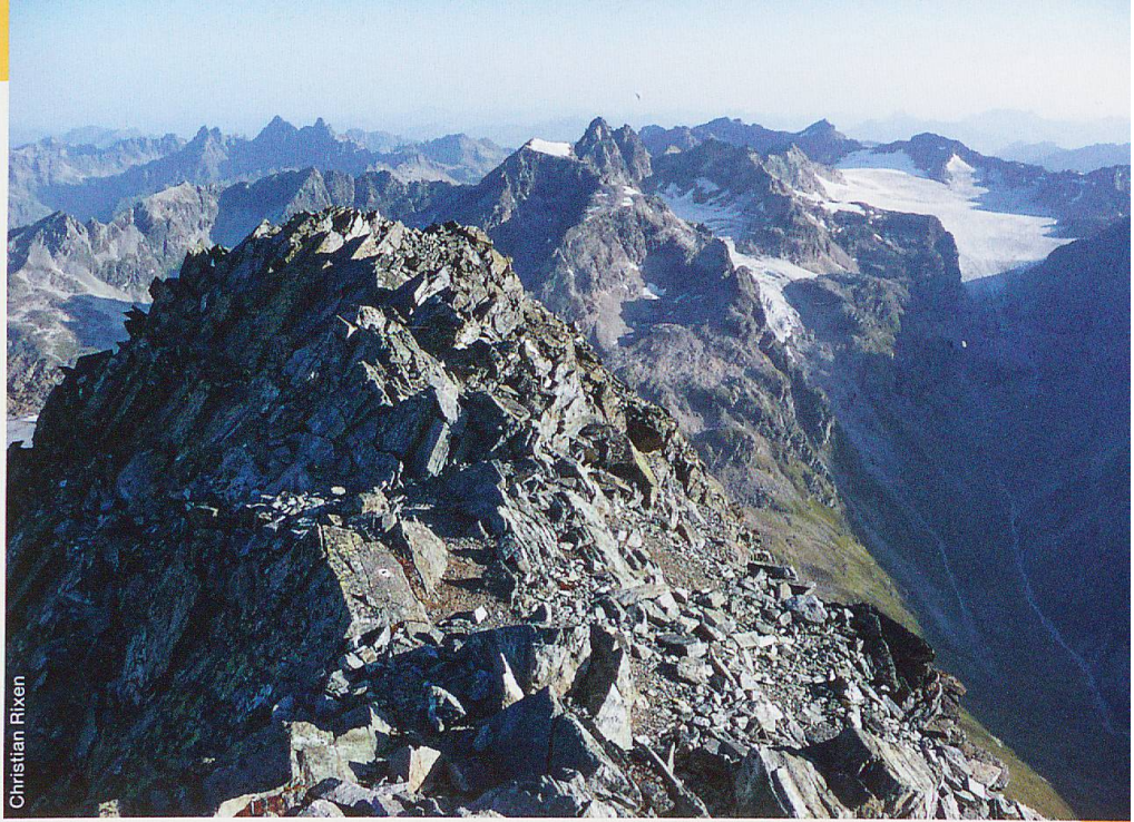
Abb. 2 Auf den ersten Blick sind keine Pflanzen sichtbar, aber in Fels und Geröll verstecken sich 16 Arten. Gipfel des Piz Linard (3410 m ü. M.).