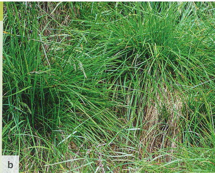
Abb. 2 Ansicht der Vegetation im Jahr 2017 in einer Zaunfläche ohne grosse Pflanzenfresser (a) und einer mit NPK gedüngten Zaunfläche (b), auf welcher der Rotschwengel aspektbestimmend ist.