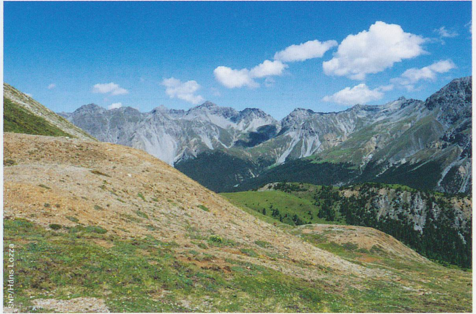
Abb. 3 Die Auswurfhalden und Ausscheideplätze auf Buffalora sind heute noch sichtbar.

des landwirtschaftlichen Areals war. Mit der Zeit entstanden auch Bergbausiedlungen: in S-charl eine ganzjährig bewohnte und in Buffalora, beim damaligen Passverkehrsstützpunkt, eine zumindest vom Frühjahr bis zum Wintereinbruch bewohnte Siedlung. Neben den Ochsen und Pferden für die Transporte hatten die Hüttenbetreiber das Recht auf Viehhaltung zur eigenen Versorgung.