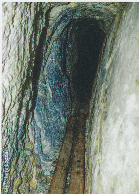
Abb. 1 Mine am Munt Buffalora mit Schienen aus Lärchenholz

Der Bergbau im SNP manifestiert sich nicht nur durch das Vorhandensein klassischer Minen (Abb. 1). Nein, wir finden auch Spuren eines gut organisierten Produktionssystems: Für den Bergbau wurden Unterkünfte für die Arbeiter gebraucht wie auch jene des Eisenschmieds, welcher das Werkzeug zum Graben und zur Erzgewinnung herstellte. Das Erz musste alsdann über Transportwege bis zu den Verhüttungsorten gebracht werden. Dort wurde das Metall aus dem Stein gewonnen. Damit das ganze System funktionierte, mussten neben den richtigen Mineralien auch Holz und Wasser vorhanden sein. Die Bergwerke lagen meist über der Waldgrenze und immer in Hanglage, da beides das Aufspüren von Lagerstätten begünstigte. Das Holz für den Bau der Stollen musste dorthin transportiert werden. Die Verhüttung erforderte grosse Holzmengen, weshalb die Hüttenwerke im nächstgelegenen walddreichen Gebiet lagen. Für den Betrieb der Gebläse und Schmiedehämmer musste zudem ein Bach in der Nähe sein, dessen Wasserkraft genutzt werden konnte. Das Holz wurde in Köhlereien zu Holzkohle verwandelt, welche für die Schmelz- und Reduktionsprozesse in den Öfen (Abb. 2) genutzt wurde. Durch die grosse Holznutzung wurde immer mehr Wald um die Hüttenwerke und entlang der Transportwege abgeholzt. Dabei entstand Weideland, welches später für das Vieh genutzt wurde und oftmals der Ausgangspunkt für eine systematische Ausweitung