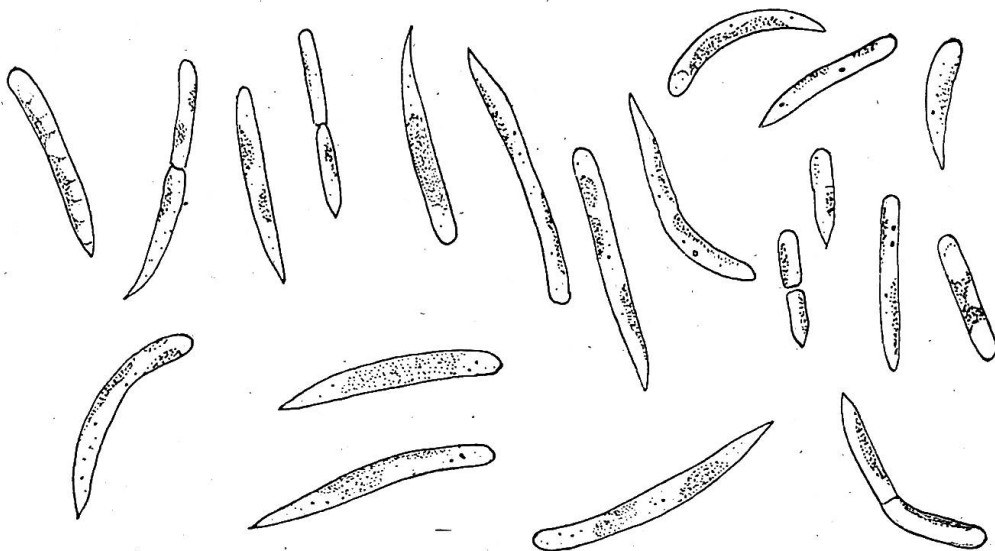
Fig. 142. Raphidonema sempervirens Chod. Agar-glycose. 1100 \times .

La première mention faite du genre Raphidonema se trouve dans un travail de Lagerheim 1) sur la flore des neiges du Pichincha. Il rapporte ce genre aux Ulothrichiacées. L'espèce décrite est une plante qui vit dans la neige colorée, elle y forme des filaments courts, cloisonnés, plus ou moins courbés. Les deux extrémités s'allongent en une espèce de soie. Les cellules, à l'exception des poils, sont cylin-