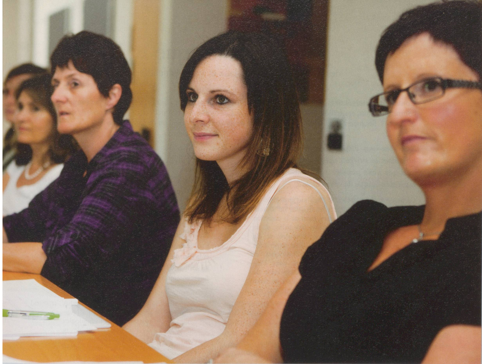
... Le programme de formation «Direction d'institution, niveau 1» se déroule d'avril 2011 à avril 2012.