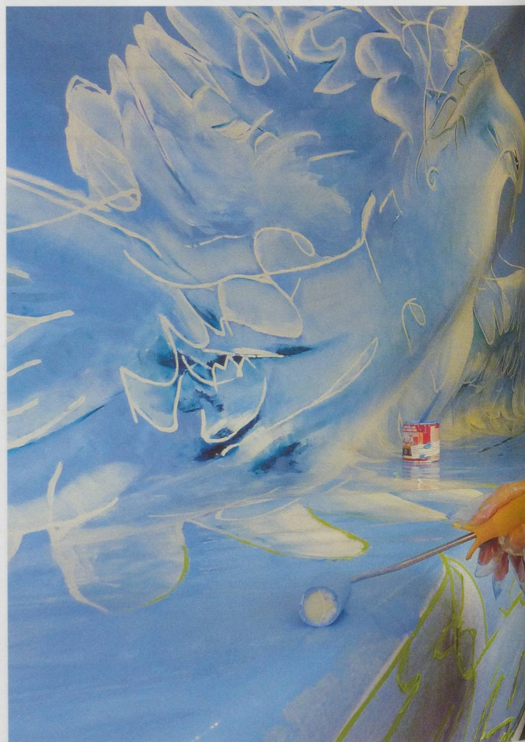
A coups de pinceaux, de rouleaux, d'éponges ou avec les doigts, quasiment

«Ce fut un projet ambitieux, un peu fou, mais rassembleur.»