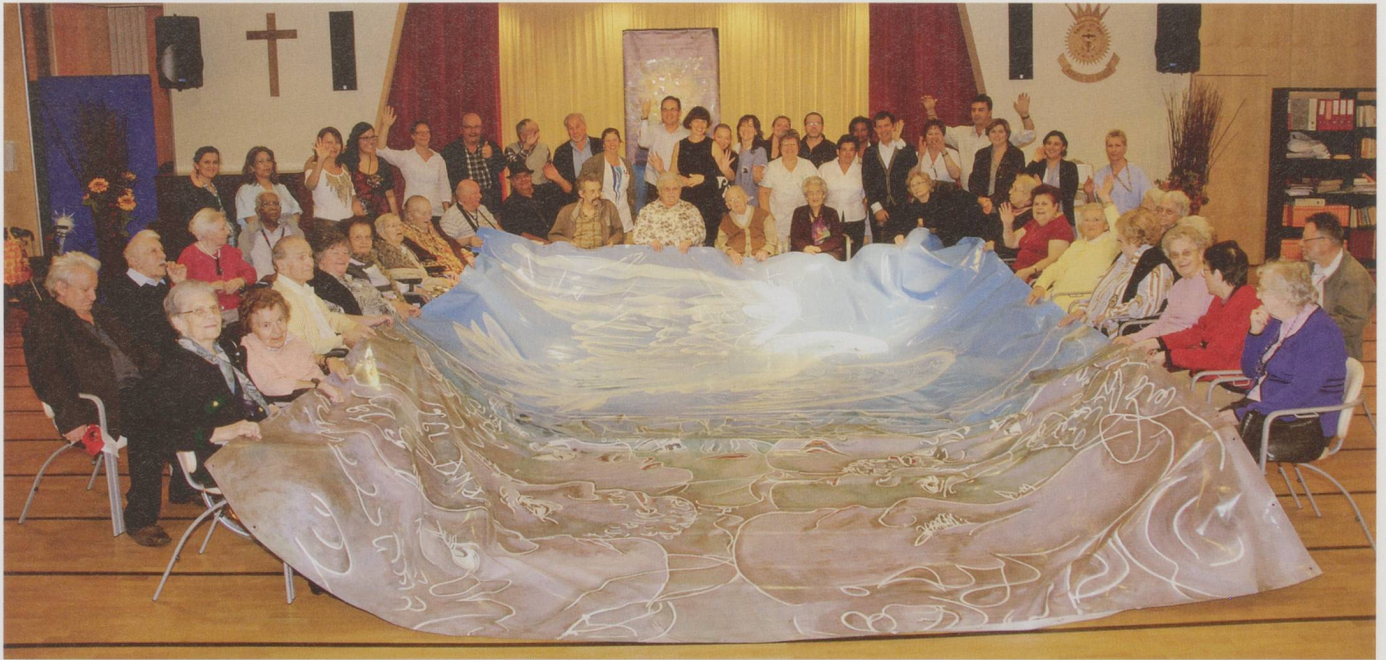
«Aspiration à la paix»: cette œuvre de Hans Erni a été reproduite pour la première fois par les résidents, aidés de quelques proches et collaborateurs de la Résidence Amitié.