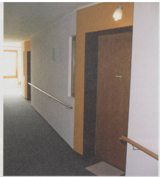
Des portes qui se fondent dans les parois de même couleur: les personnes souffrant de déficit visuel n'ont aucune chance de retrouver leur chambre (à g.). Des couleurs contrastées, des portes renfoncées et une entrée clairement signalée: exemplaire (à d.)