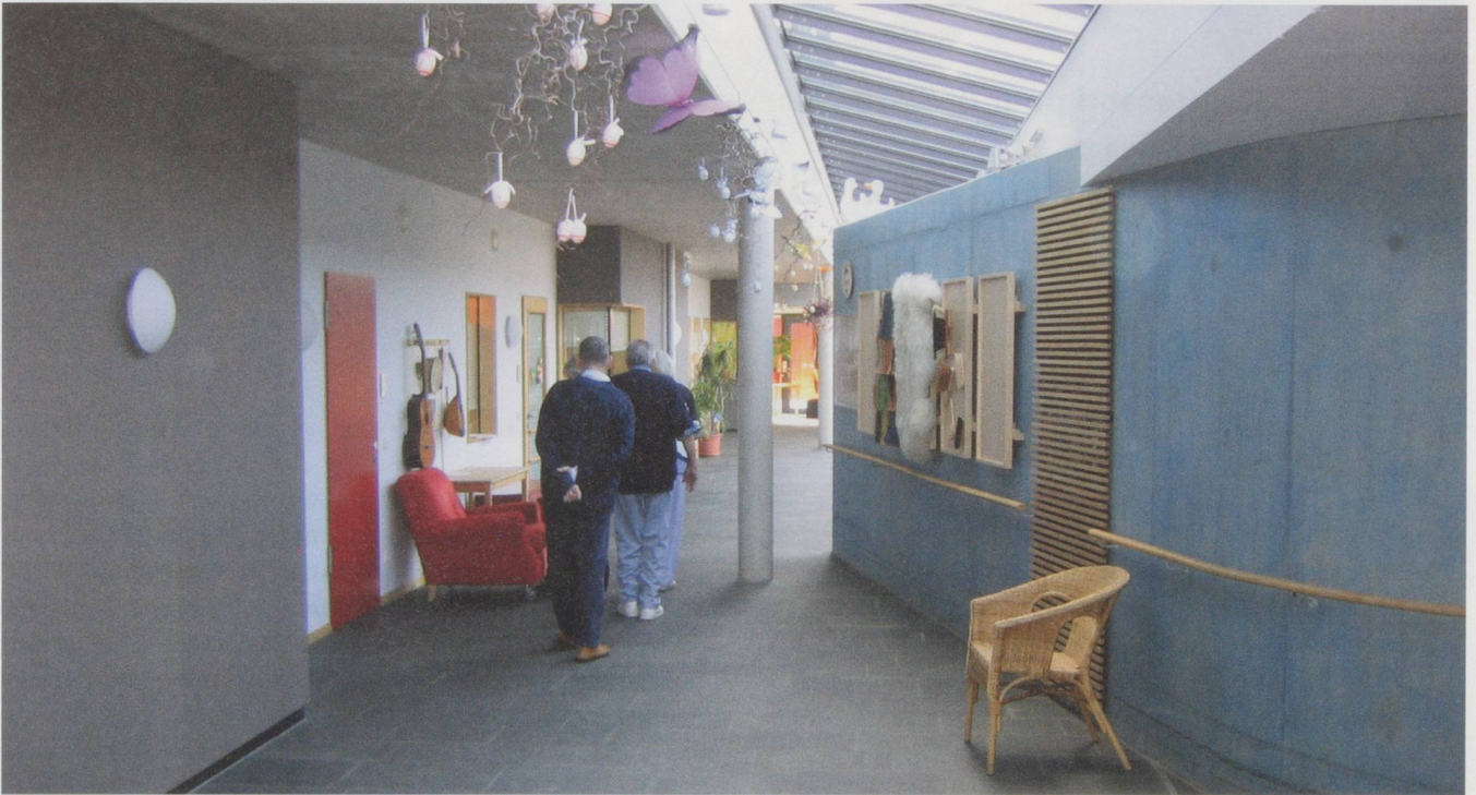
Le bon et le moins bon se côtoient: des matériaux représentatifs donnent des revêtements de sol qui miroitent, qui brillent et sont glissants (en haut, à d.). Les traits noirs qui marquent le bord des marches d'escalier permettent de s'orienter, contrairement aux marches sans ces mêmes traits noirs (en haut, à g.). Le choix des couleurs et l'aménagement intérieur pour casser la monotonie, une lumière zénithale: une unité exemplaire accueillant des personnes souffrant de démence (en bas)

du travail des soignants. Et pourtant, dans la planification, elles sont reléguées au second plan. Dans la très grande majorité des projets d'architecture issus de concours, la chambre ressemble invariablement à celle d'un hôpital ou d'un hôtel, alors que ce modèle n'est ni idéal ni le seul possible à envisager pour un EMS.