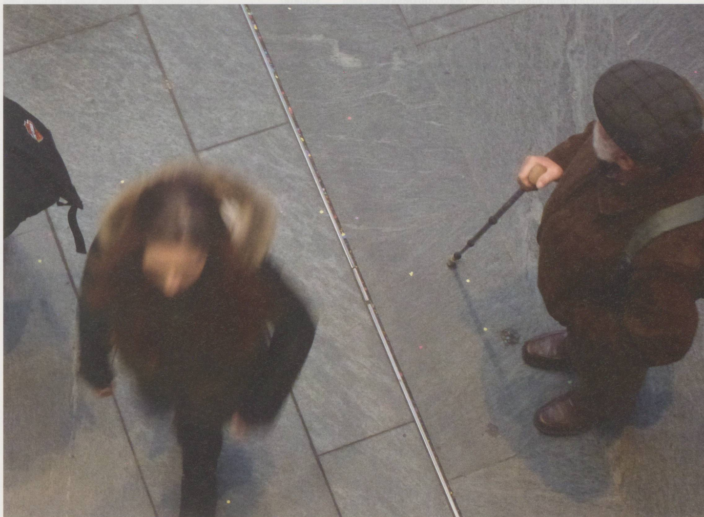
Comme ici en gare de Berne, on croise davantage de cheveux gris que par le passé, le samedi après-midi dans les zones piétonnes.