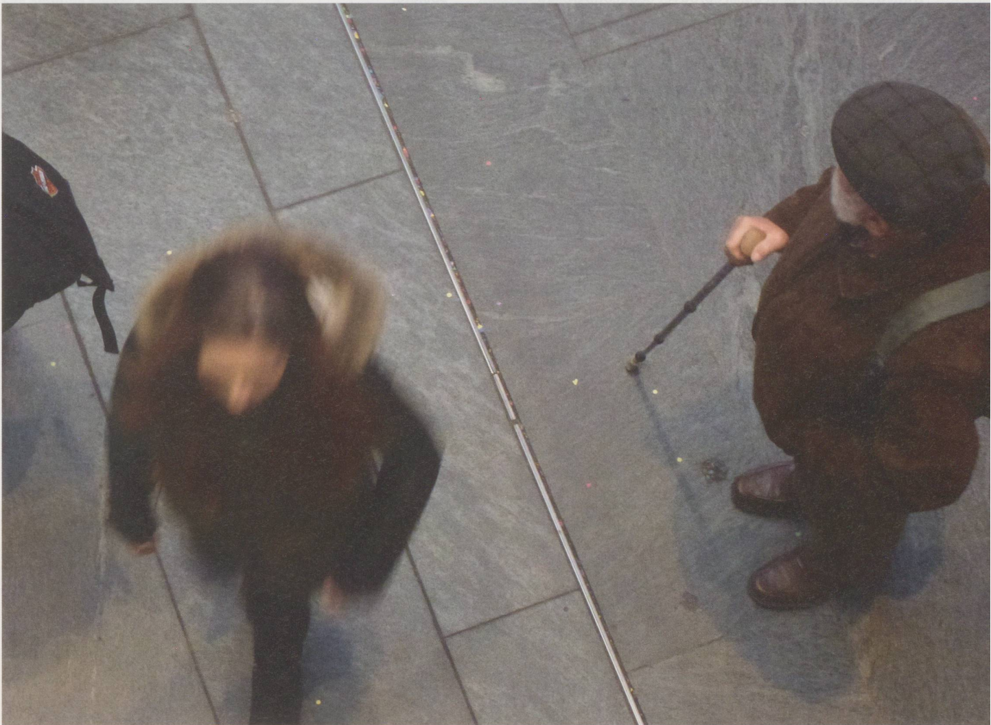
Comme ici en gare de Berne, on croise davantage de cheveux gris que par le passé, le samedi après-midi dans les zones piétonnes.