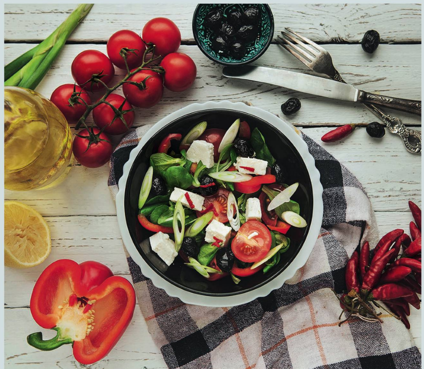
Le régime méditerranéen fait partie d'une alimentation saine.

On peut être en forme jusqu'à un âge très avancé. Finalement, il s'agit de rester actif le plus longtemps possible pour pouvoir participer à la vie, faire ce qu'un ami fait et préserver ainsi sa propre indépendance. Tous nous aspirons à faire partie de ceux qui vieillissent en bonne santé, sans problèmes majeurs de santé. Pour ce faire, nous devons procéder comme déjà discuté, connaître les facteurs de risque cités plus haut et agir, se bouger, avoir une bonne alimentation et aussi veiller à avoir une bonne attitude face à la vie.