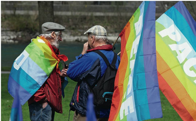
Stimuler le cerveau avec le jeu d'échecs, maintenir sa forme physique avec des promenades et rester socialement actif comme le font ici ces seniors qui participent à une manifestation pour la paix.