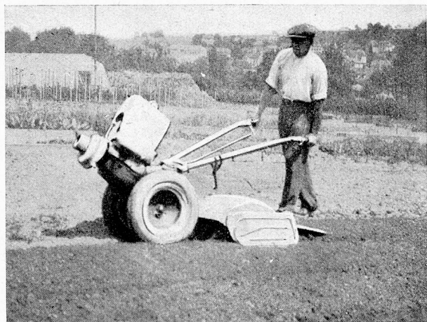
Neue 8 PS Grunder-Bodenfräse Normale Fräsarbeit, 75 cm Arbeitsbreite