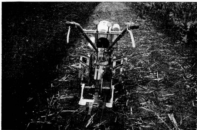
Neue 8 PS Grunder-Bodenfräse mit einfacher Seilwinde für Winter-Pflugarbeit

Die Maschinenfabrik Grunder-Binningen bringt nun auf 1938 eine neue 8 PS Bodenfräse heraus, in welcher die beinahe 20-jährigen Erfahrungen mit ihren bewährten 2-4 und 6 PS Bodenfräsen verwertet sind. Mit ihren 4 Gangarten und 2 verschiedenen Fräsgeschwindigkeiten bietet diese neue Maschine neue, weitgehende Variation von feinsten, tiefer Krümelstruktur bis faustgroßen Brocken, zweifellos eine neue, wichtige Entwicklungsstufe der Bodenfräskultur.