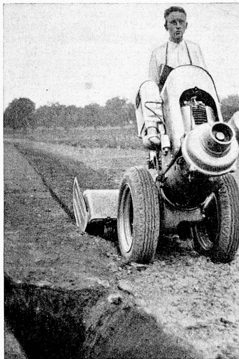
Neue 8 PS Grunder-Bodenfräse Feinste Fräsarbeit auf 30 cm Tiefe (langsamer Gang bei schneller Drehzahl der Fräse)

geklärt und anerkannt ist. Schon bei einer Kulturfäche von zirka 5000 m 2 , die beispielsweise jährlich 3 mal gefräst wird, macht sich eine Maschine in der Preislage von zirka Fr. 1500.— bei Annahme des üblichen Ansatzes von 10 Rp. per m 2 für Spatenarbeit schon in einem einzigen Jahre praktisch bezahlt, während die Lebensdauer der Maschine nach den bisherigen Erfahrungen 10 bis 20 Jahre, je nach Betriebsgröße, be-