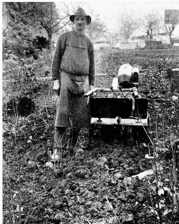
Neue 8 PS Grunder-Bodenfräse Schollen-Struktur (Schnellgang bei langsamer Drehzahl der Fräse)