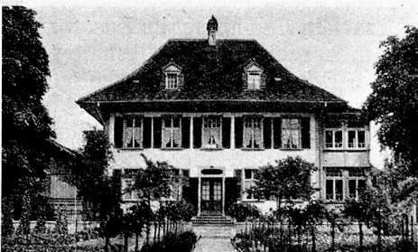
Das Erholungsheim Neuhaus