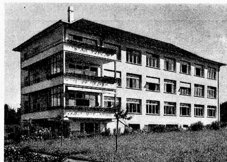
Das neue Krankenhaus