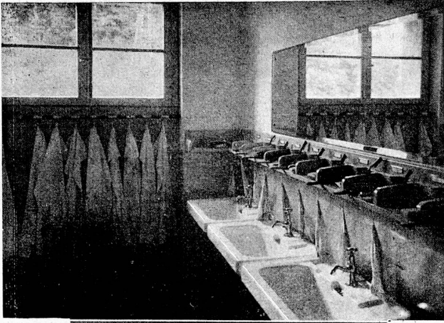
Oberes Bild: Waschraum